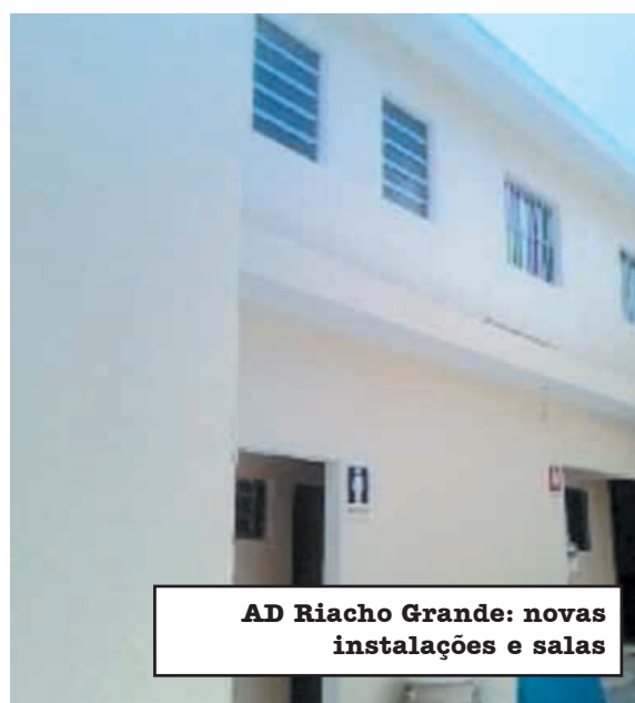
AD Riacho Grande: novas instalações e salas