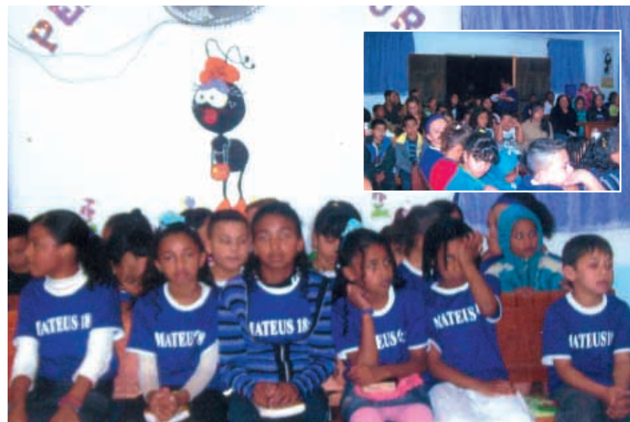
Crianças da AD Taquacetuba durante evento realizado em outubro

Que Deus abençoe os irmãos de Taquacetuba pela dedicação no cuidado com suas crianças e na oração perseverante!!