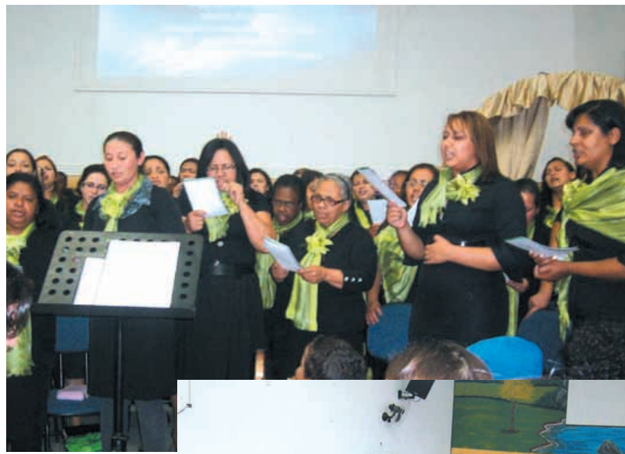
Acima, foto do Grupo de Senhoras louvando a Deus no 36º Congresso. Abaixo, interior do Templo durante o Chá de Mulheres

Que Deus continue abençoando a todos os membros da Congregação da igreja Assembleia de Deus do Jardim Thelma, e que esse empenho para a obra de Deus seja constante.