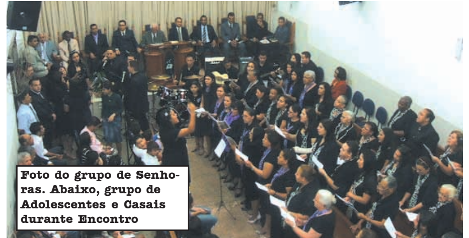
Foto do grupo de Senhoras. Abaixo, grupo de Adolescentes e Casais durante Encontro

Que Deus continue abençoando a todos os membros da Congregação de Vila Esmeralda, pelos maravilhosos trabalhos realizados!!