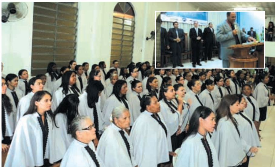
Irmãs durante evento. No detalhe, púlpito da Igreja em Goiânia