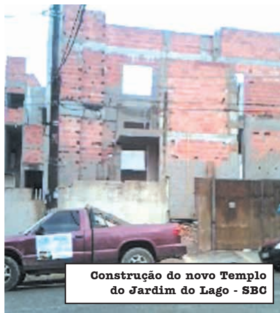
Construção do novo Templo do Jardim do Lago - SBC