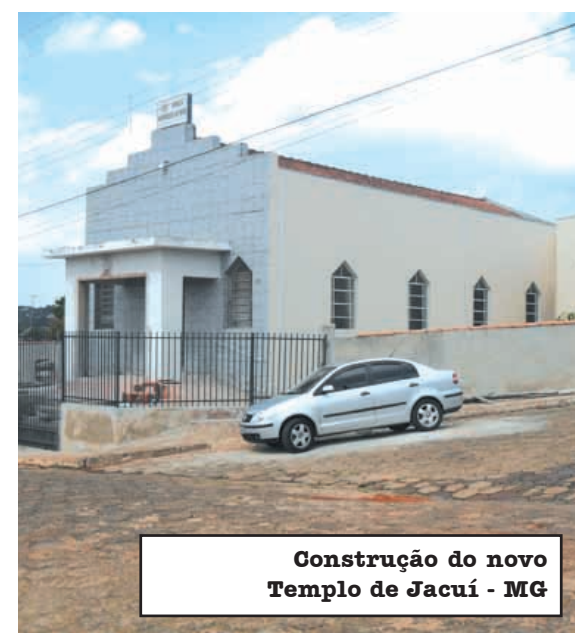
Construção do novo Templo de Jacuí - MG