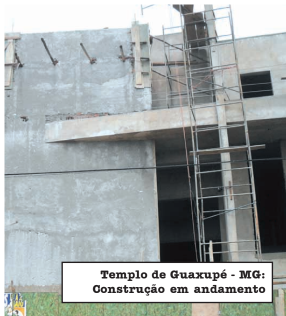
Templo de Guaxupé - MG: Construção em andamento