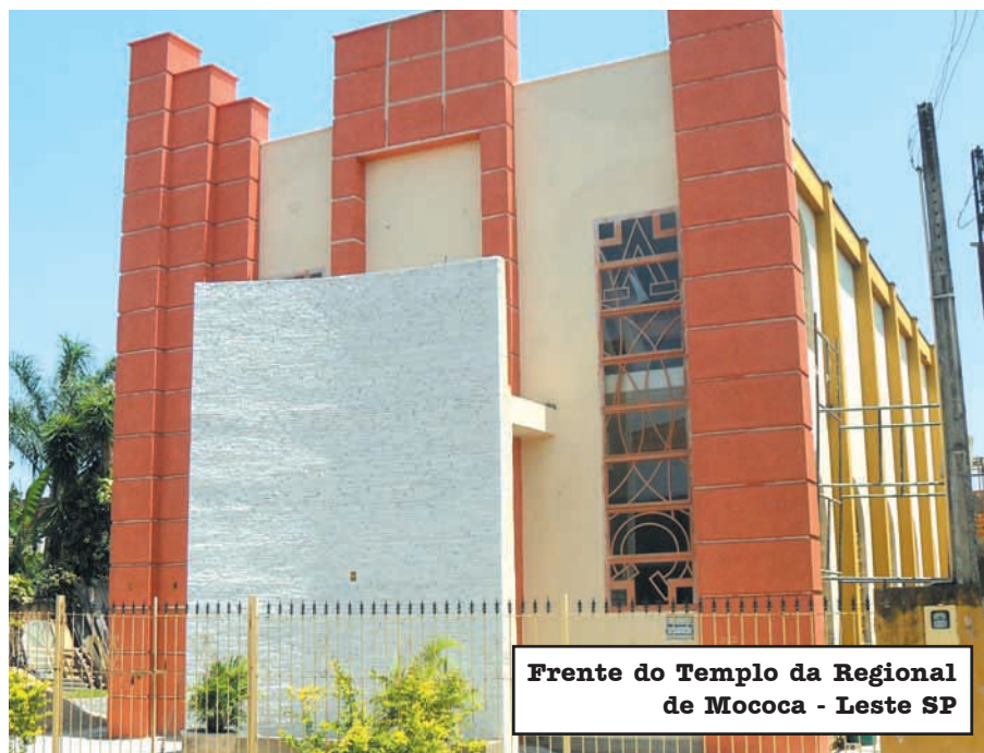
Frente do Templo da Regional de Mocooca - Leste SP

Podemos observar que com pequenas coisas se faz grandes obras. A Diretoria Executiva aproveita o momento para agradecer a Deus pela vida dos dizimistas e ofertantes, que por sua fé pode agora contemplar os grandes feitos do Senhor!