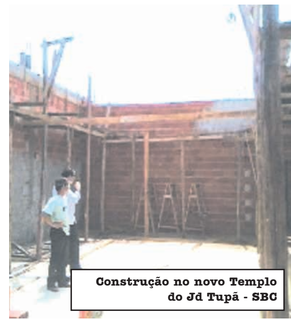
Construção no novo Templo do Jd Tupá - SBC