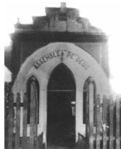
Primeiro Templo Assembleia de Deus em Belém do Pará