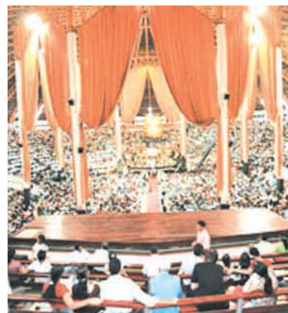
Interior do Templo da Assembleia de Deus em Mato Grosso: um dos maiores Templos da América Latina