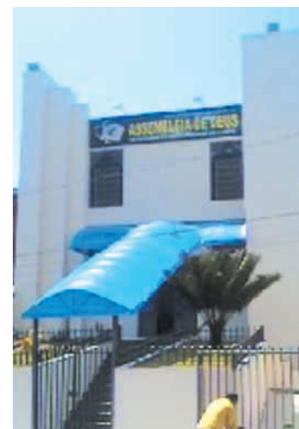
Frente do Templo da AD Riacho Grande - Reformas