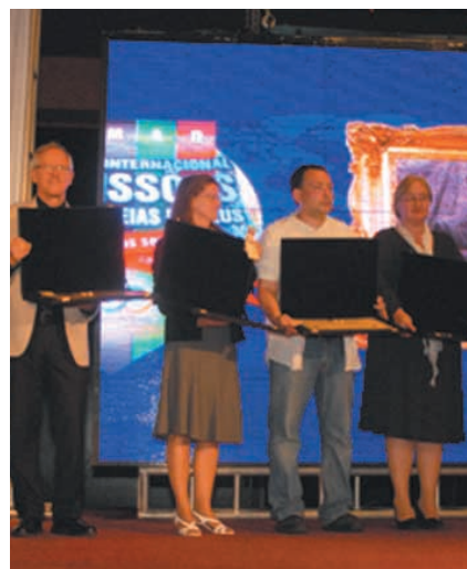
Neto dos missionários vêm ao Brasil às comemorações