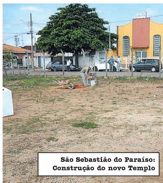
São Sebastião do Paraíso: Construção do novo Templo