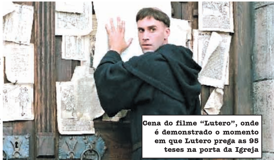
Gena do filme "Lutero", onde é demonstrado o momento em que Lutero prega as 95 teses na porta da Igreja